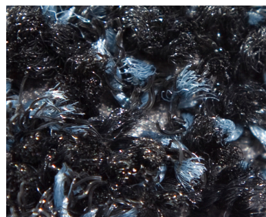
Couleur: Onyx Brush