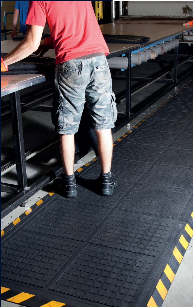
Standaard afmetingen (cm)