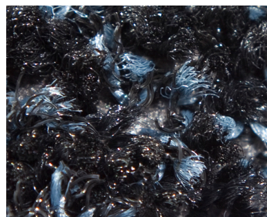
Kleur Onyx Brush