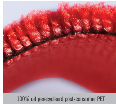
100% uit gerecycleerd post-consumer PET

Maximale afmeting: 200 cm x 550 cm Maatafwijking: +/- 2%