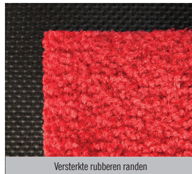
Versterkte rubberen randen