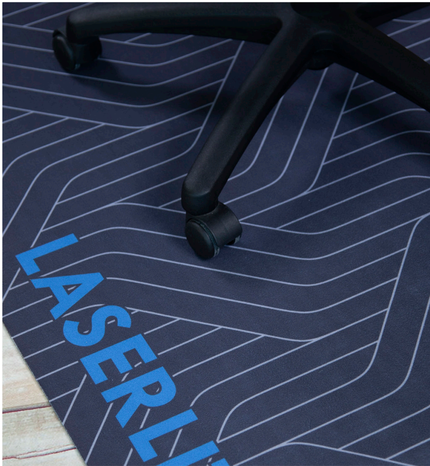
Product No. 32765