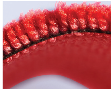
100% PET Teppich